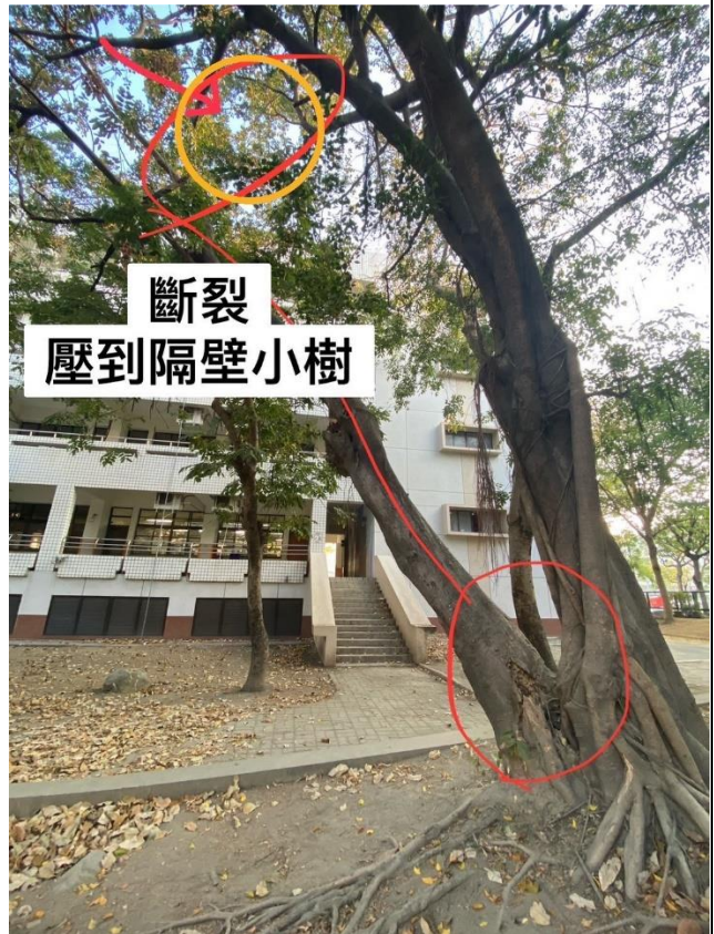
本支目前倚靠鄰棵樹木撐住，方未倒下。