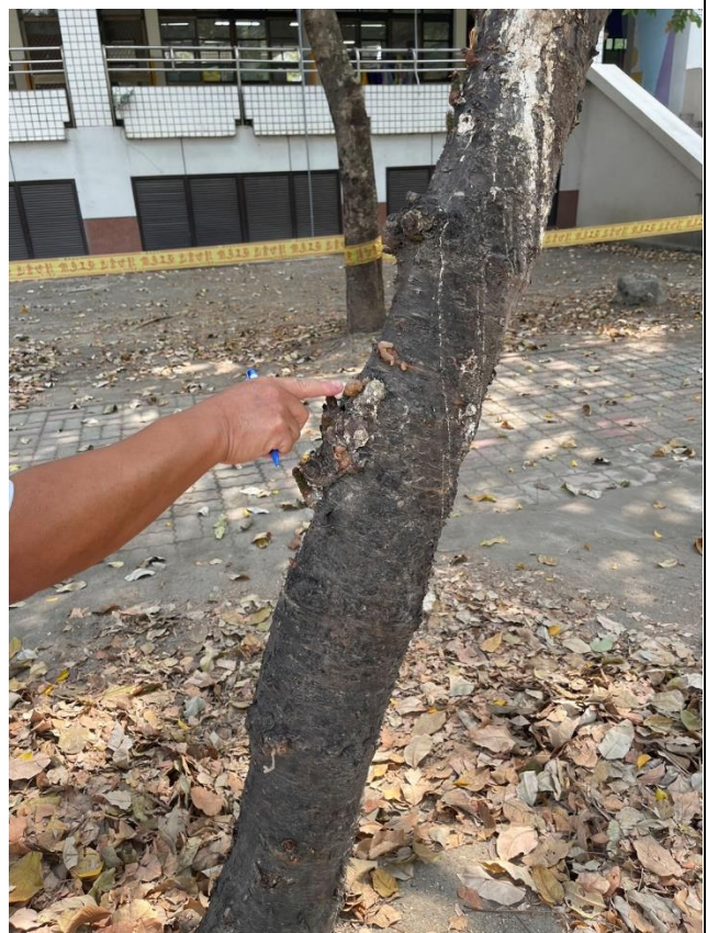
小株南洋杉有流膠現象，亦有蟻蝕問題。