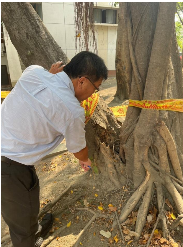
垂葉榕分叉處位於根領上方，屬最危險等級之樹木型態，且主幹皆以腐朽及裂開，