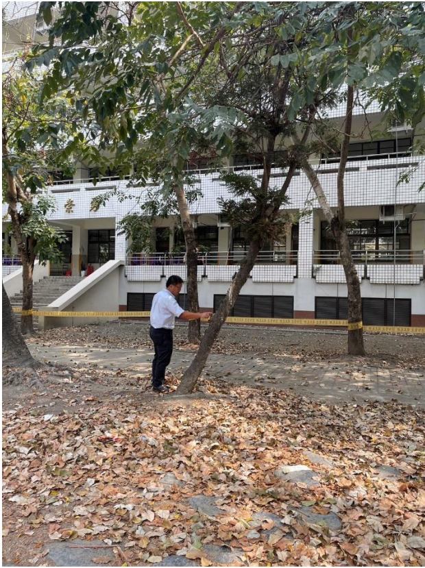
小株南洋杉往遊樂器材區外側傾斜，傾斜角度過大，實有危險之虞。